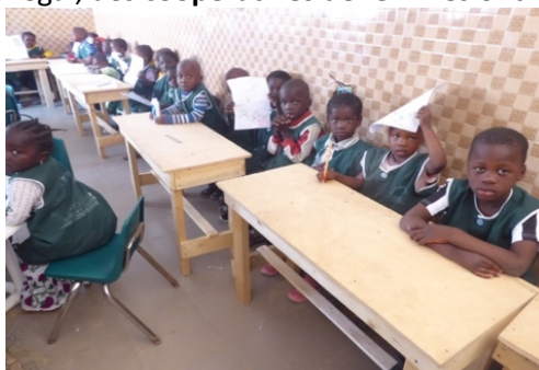
Les enfants de l'école Mere Rue ont maintenant des tables et des bancs

Au Sénégal : Ces sommes nous ont permis de poursuivre notre aide substantielle et régulière à Saint-Louis : MERE RUE accueille et nourrit grâce à notre association 126 enfants (100 auparavant), âgés de 3 à 8 ans. Mere Rue a reçu la somme de 5'000 € . Sans le Club Richelieu, nous n'aurions pas pu contribuer autant. PALETTE a reçu la somme de 1'700 € pour la construction et la diffusion d'une quinzaine de cuisinières solaires pour les réfugiés climatiques . Cela change la vie de 300 personnes pendant plusieurs années. ARADES a reçu 4'700 € pour les grands paniers thermiques pour les réfugiés climatiques et les commandes de produits artisanaux qui donnent du travail aux femmes. Trois machines à coudre leur ont été offertes. L'Ecole NDioum Wallo a reçu 300 € pour lancer un jardin écologique fait avec les enfants. Lors de notre voyage au nord du Sénégal, des coopératives de femmes ont reçu au total la somme de 1'200 € .