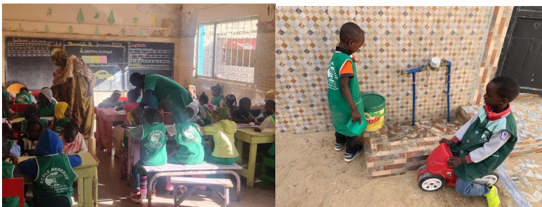
MERERUE en 2025 : grâce à l'association, les enfants ont de vraies classes et un accès à l'eau a pu être fixé dans la cour de récréation

2.1 MERERUE : nourrir tous les jours et éduquer les jeunes enfants de ce quartier défavorisé - notamment leur apprendre le français dont ils auront besoin à l'école primaire - est une énorme tâche quand on sait que cette école maternelle ne reçoit aucun subside et que tout le personnel est bénévole ; c'est pour cette raison que nous tenons à ce que chaque bénévole régulier (8 personnes) reçoive une modeste indemnité d'environ 15 € chaque mois. Avec l'alimentation quotidienne des enfants, notre engagement est au-dessus de nos capacités. Nous avons pu envoyer 3'750 € à MereRue .